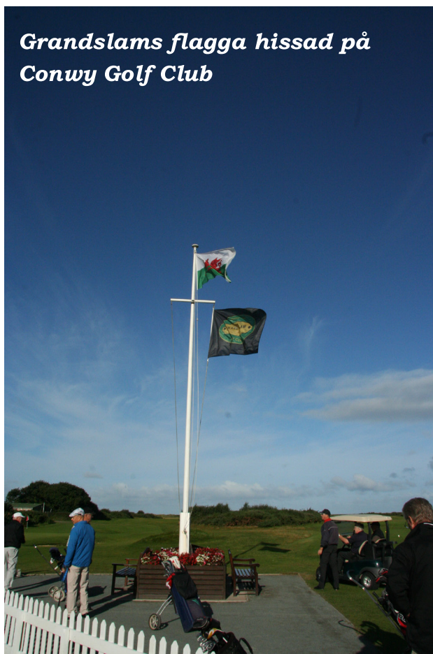
Grandslams flagga hissad på Conwy Golf Club