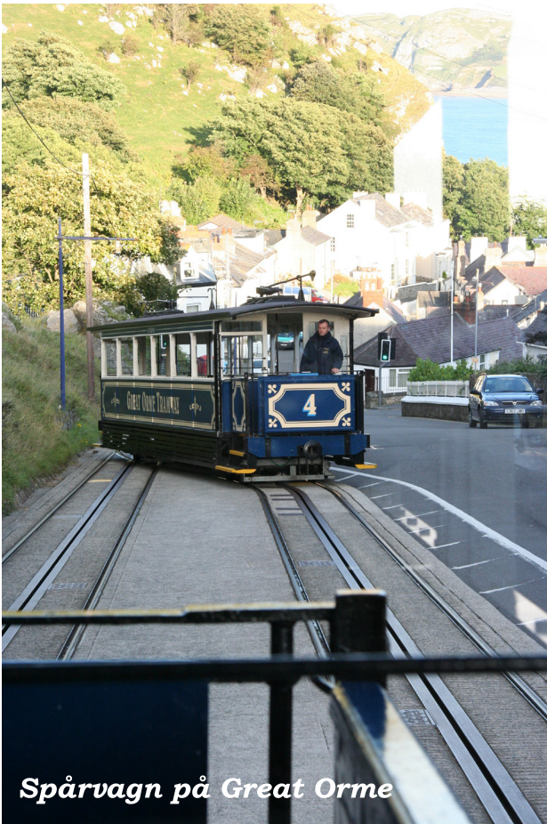
Spårvagn på Great Orme

hade intagit sin gamla plats vid frukosten, kunde via sina väderkällor rapportera att ett visst regnmoln kunde drabba oss.