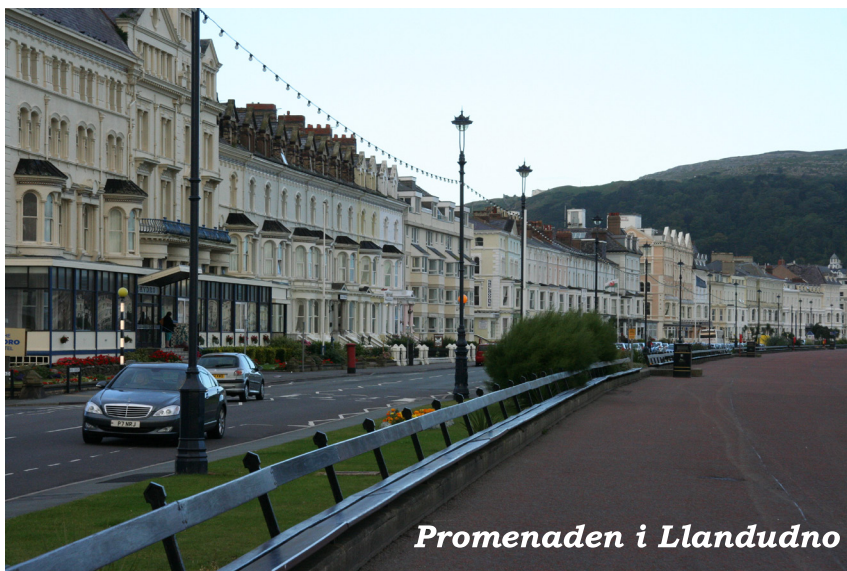
Promenaden i Llandudno