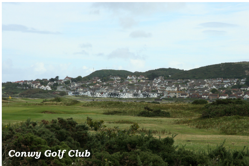
Conwy Golf Club

Vissa moln hade infunnit sig och Bosse, som idag