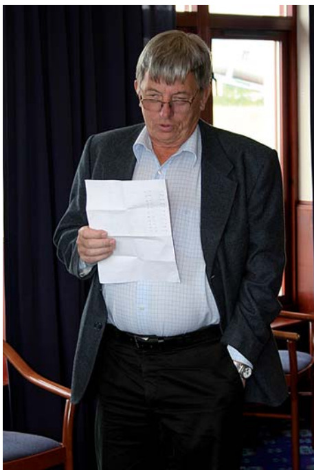
Guy redogör för avgifter

skulle hålla i sig för resten av tävlingen var det ingen som tvivlade på då. Men som den välunderrättade skribent den under-tecknade nu är, kan jag redan nu lugna läsekretsen med att säga att det gjorde det då rakt inte.