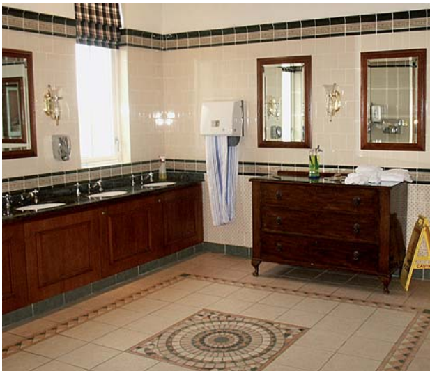
Som drottning Victorias boudoir.

ende inför den höga glasburken med den gröna vätskan och de många kammarna. Intet skall dig fattas i denna boudoir.